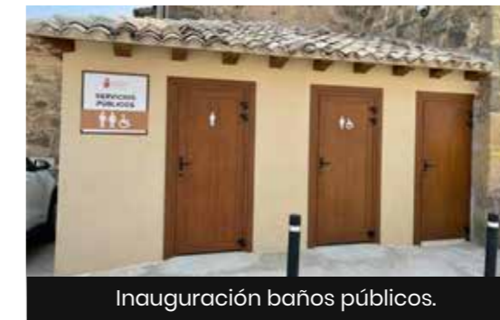
Inauguración baños públicos.