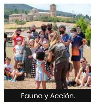
Fauna y Acción.