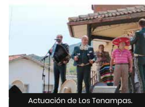
Actuación de Los Tenampas.