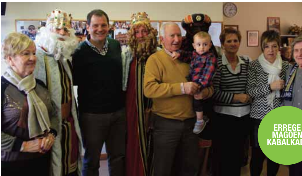
ERREGE MAGOEN KABALKADA